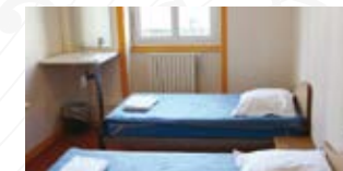
Ex. chambre multiple éco