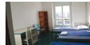
Ex. chambre multiple confort