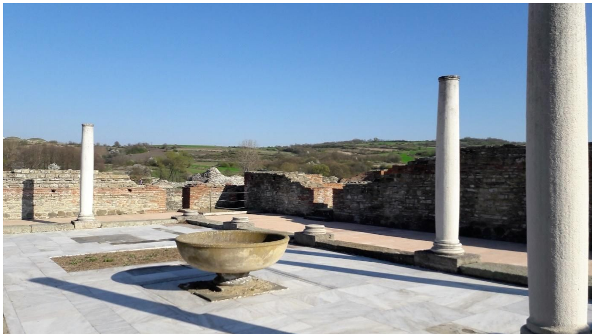
Felix Romuliana (Photo Hélène Despic, avril 2017)

Jour 7 –Départ vers le site de Felix Romuliana, le seul site romain de Serbie à être protégé par l’Unesco. Visite. Puis départ vers Belgrade. Déjeuner en route. Installation à l’hôtel. Dîner et soirée libre.