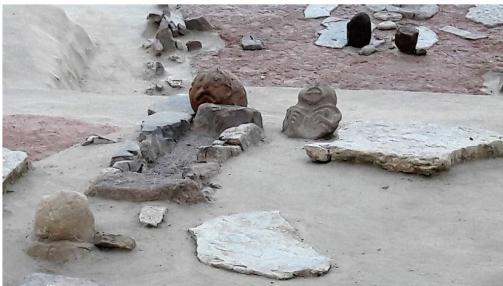
Lepenski Vir (Photo Helene Despic, mars 2017)

Lepenski Vir : Les données font remonter autour de 7000 avant J.C une première présence humaine dans ce lieu remonte autour de 7.000 av. J.C. Mais la localité, un village de pêcheurs, a connu son apogée entre 5.300 et 4.800 av. J.C. Le site a été découvert en 1965 et recouvert en 2010 d'un toit de verre pour empêcher les dégradations. Ses statues sont encore peu connues dans le monde.