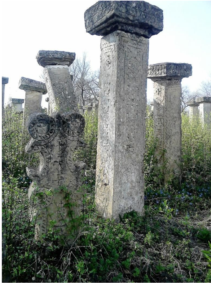
Ancienne tombe valaque (Photo H  l  ne Despic, avril 2017).

Jour 5 – Chez les Valaques, une communauté autochtone également appelée Aroumains, qui a conservé d'étranges rites funéraires et magiques. Visite des cimetières dans les villages situés au sud de Kladovo. Déjeuner dans une famille qui héberge des touristes. Apprentissage d'une recette valaque. Rencontre avec un ethnologue ou un dignitaire local. Dîner et nuit au gîte.