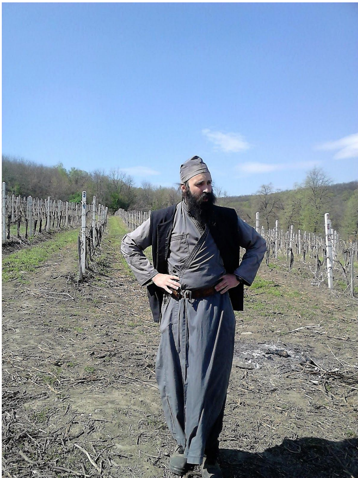
Les vignes du monastère de Bukovo, près de Negotin (Photo Hélène Despic, avril 2017)

Jour 6 – Départ tôt le matin pour une journée de vendanges et de dégustation au monastère de Bukovo. Les non vendangeurs se promènent et vont à Rajac et Rajacke Pimnice, les anciennes caves de la région, où ils déjeunent. Dîner autour du vin. Nuit en gîte