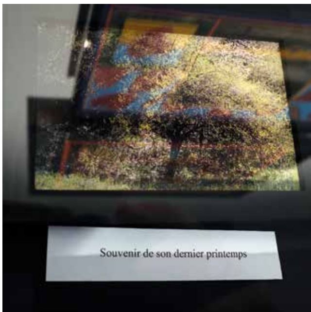
Souvenir de son dernier printemps