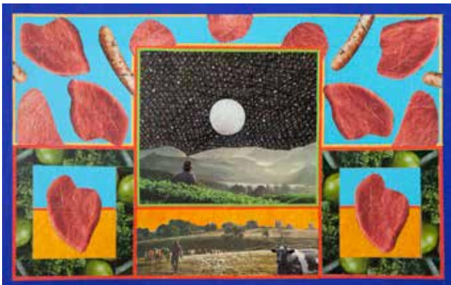
Coeurs blessés d'une vache écologique et amoureuse 25x40 cm, 2022