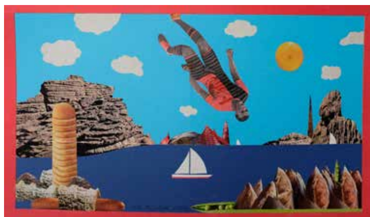
La chute d'Icare, 30x50 cm, 2023