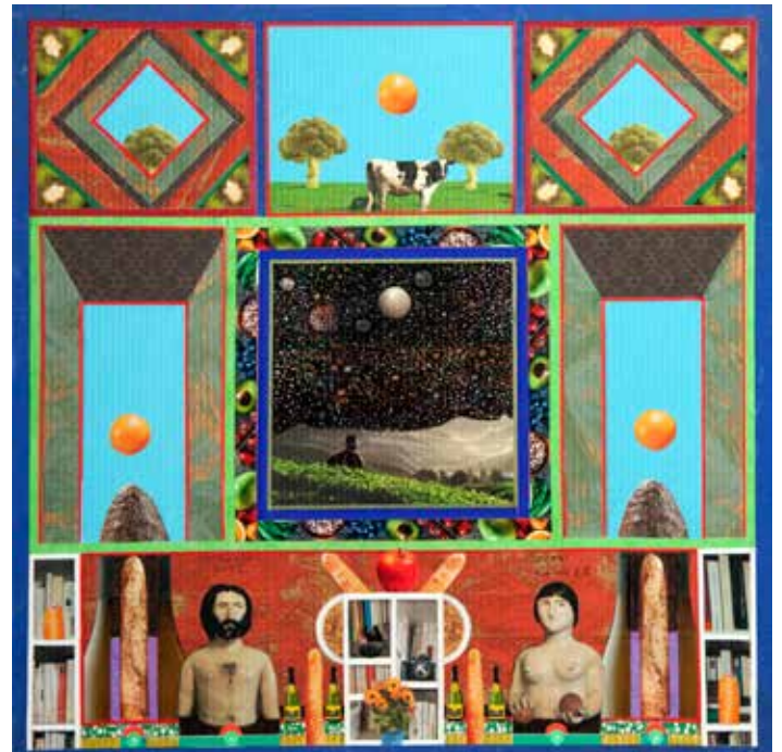
Le dernier Werther de Sarajevo et ses parents , 45x45 cm, 2022