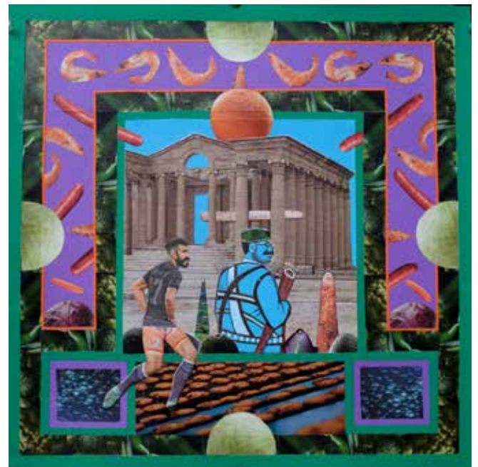
En attendant le retour de la reine Zenobi au coucher du soleil, 38,7x38,7 cm, 2024