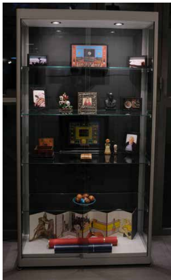
Vitrine verticale d'objets et photographies appartenant au vieux Werther. 2024