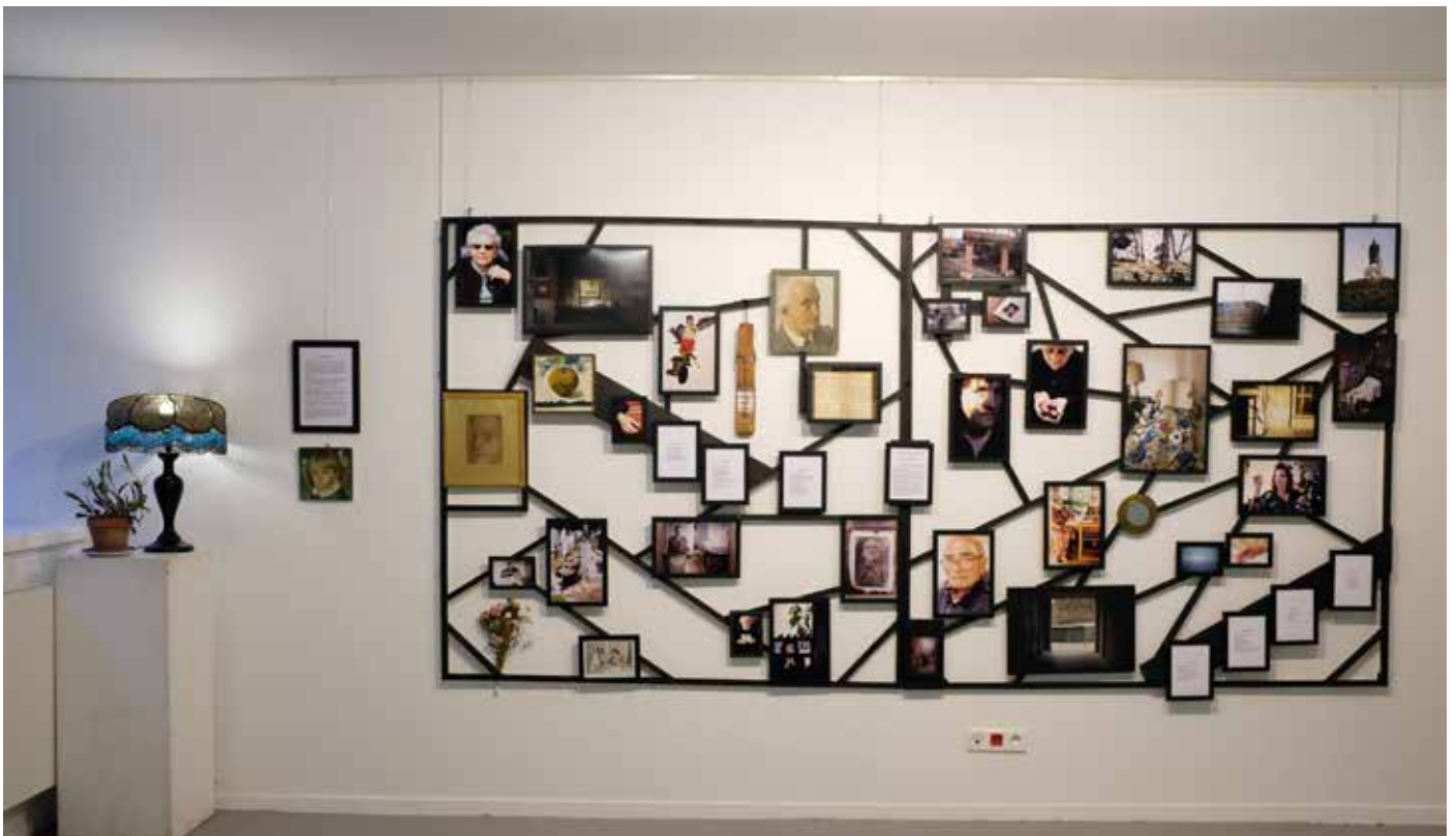
Autel de Belgrade, 3m