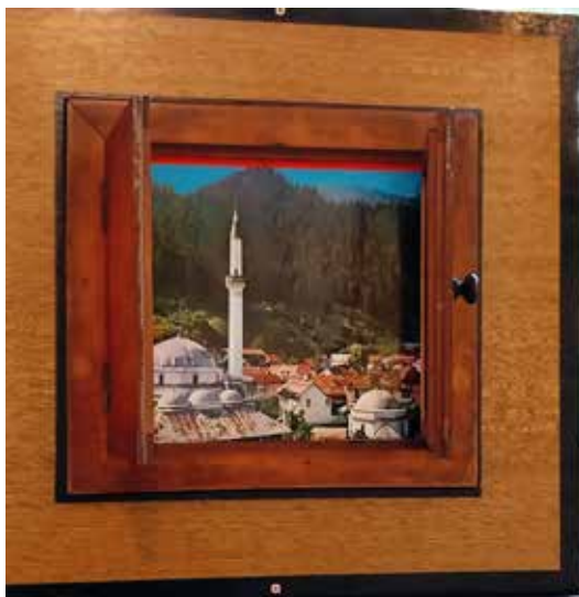
Vue au travers de la fenêtre de la mansarde de Werther. Après ouverture veuillez fermer la fenêtre délicatement pour cause de courant d'air violent. (prêt de l'actuel propriétaire qui souhaite garder l'anonymat) 2024