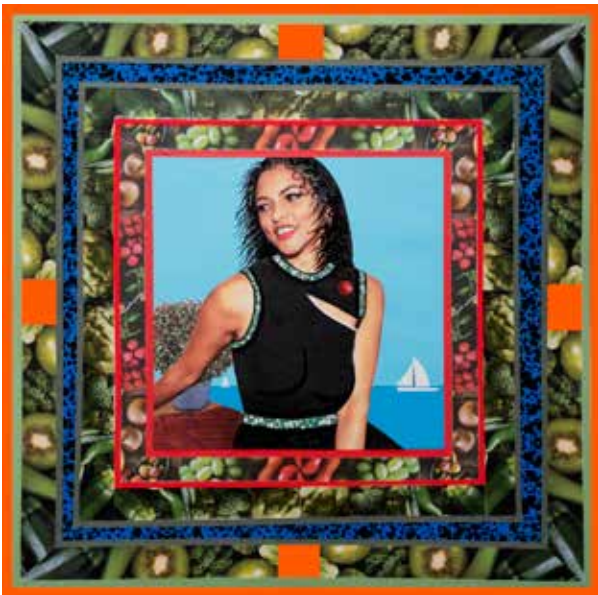
Carmen croate, 39x39 cm, 2023