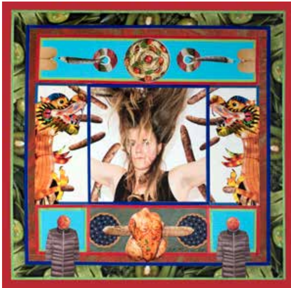
Médée de Malakoff, 39x39 cm, 2023