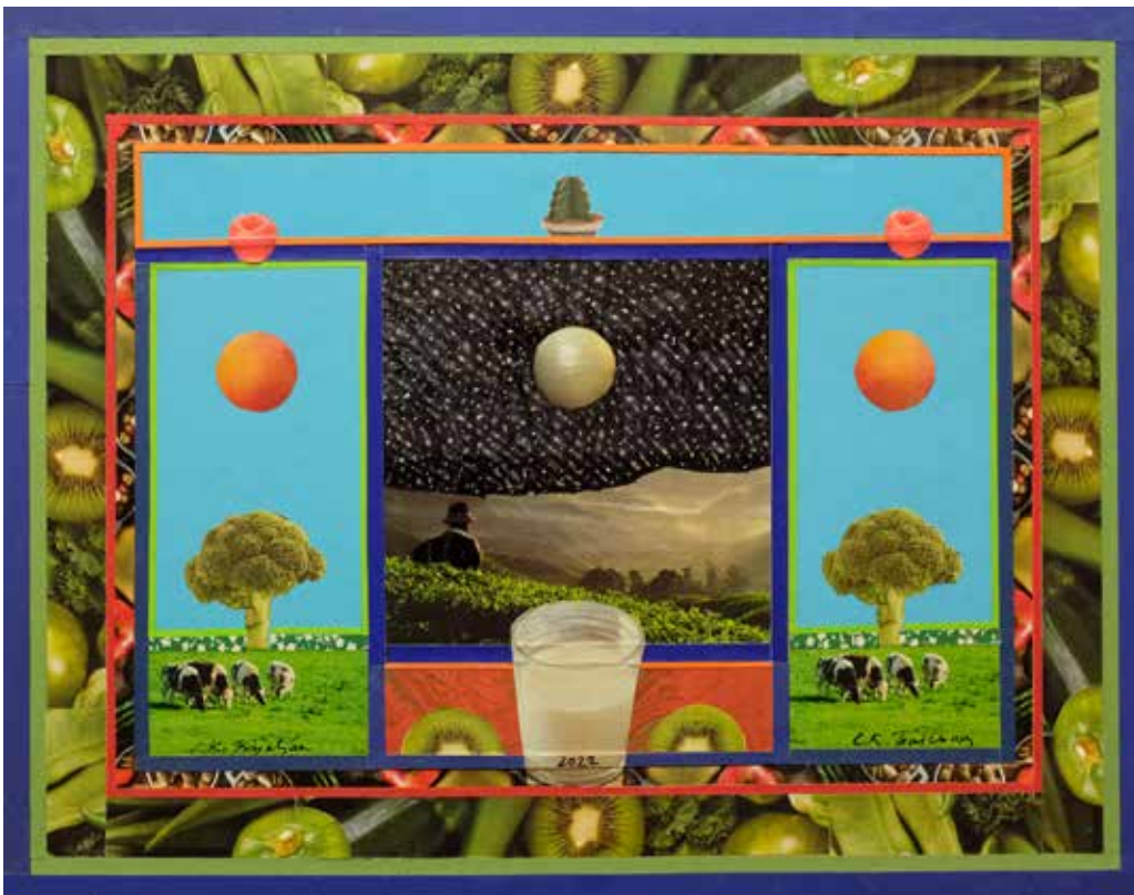
Le vieux Werther assis sur la montagne Trebevich contemple sa ville natale tandis que la pleine lune l'observe , 45x45 cm, 2022