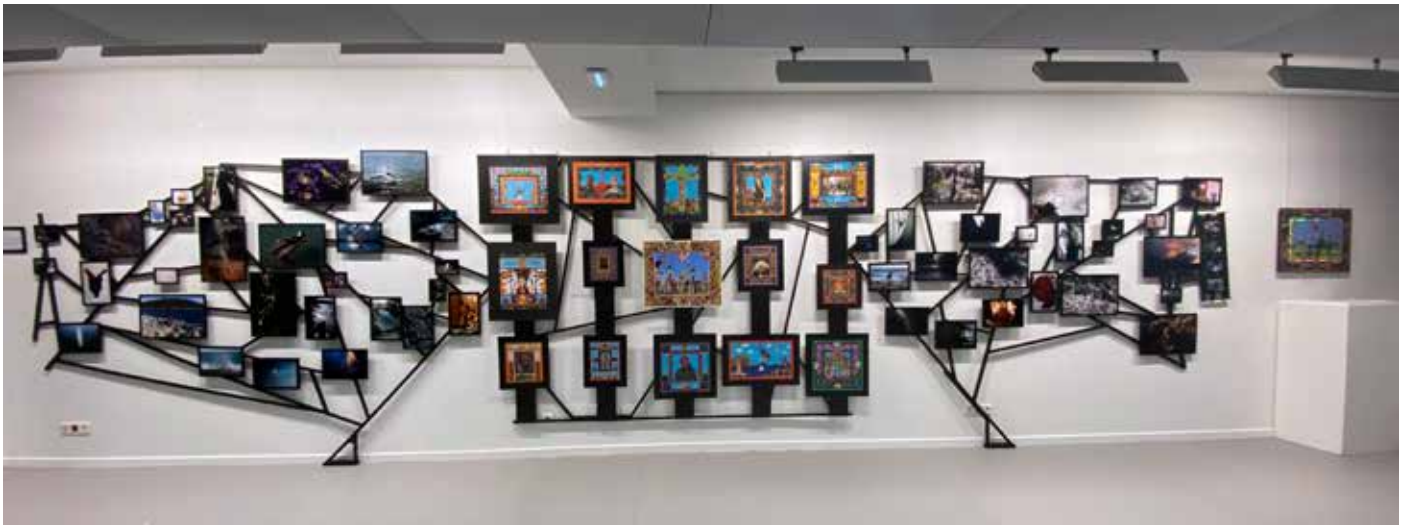
Autour de soi tout est à vif / Mythologies méditerranéennes, 9m