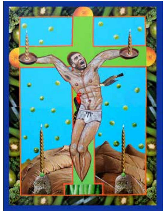
Prométhée, 39x39 cm, 2023