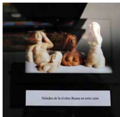
Souvenirs de la rivière Bosna en terre cuite